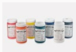
RISOAQUA Tinte 1.000 ml