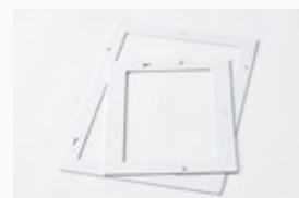
MiScreen a4; Karton Papierrahmen