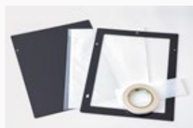
MiScreen a4 Schablonenerstellung Starter-Kit